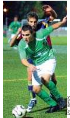
L'equip vol pujar a Primera