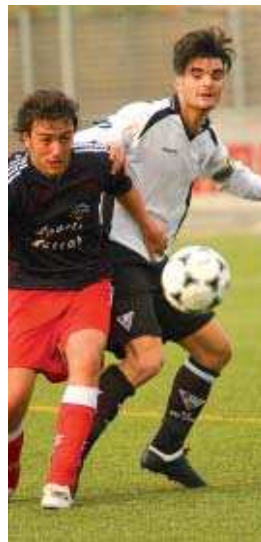
Els de Terra Nostra van guanyar la Planada 2-1

ànims van baixant i psicològicament no estem en el nostre millor moment, però si guanyem un partit, l'equip es creixerà" , apunta, confiat l'entrenador, esperant recuperar les lesionades i deixar de provar trencaclosques per encaixar les peces en els darrers partits. La propera setmana, l'Escola rep a casa al Bonaire, on "esperem que arribi l'anhelada victòria que ens catapulti cap als bons resultats" , desitja el tècnic.