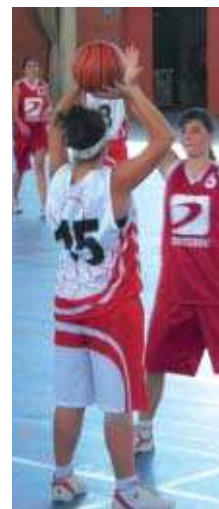
El femení vol ser un referent

Les persones interessades es poden inscriure a les oficines de l'IME, situades al carrer Tarragona, 32, en horari de matí i tarda. Des de l'IME s'ha animat totes aquelles persones que els agrada ballar però mai han fet cap cursset per manca de parella.