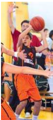
El club té un total de 14 equips

Altres equips. En línies generals, els conjunts de l'Elvira-La Salle han tingut un inici de competició bastant bo. Un dels més destacats és el sots-21 B, el bloc que la temporada passada era el júnior masculí, que ha obtingut dues victòries força còmodes. L'última va ser a casa con-