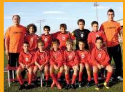
L'equip benjamí A de l'EF Montcada