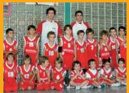
Els jugadors de l'Escola del CB Montcada