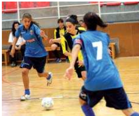
El cadet femení del FS Mausa Montcada en un dels matxs de preparació

La resta d'equips debutarà a la lliga els dies 17 i 18 d'octubre amb les esperances de mantenir el nivell. En el cas del