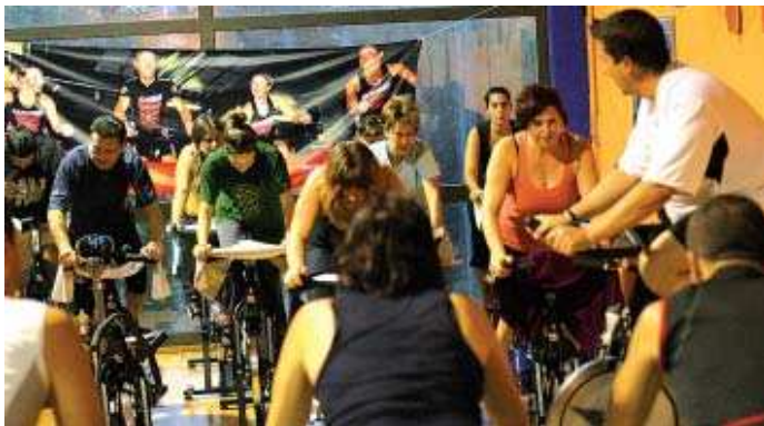
L'spinning és una de les activitats dirigides que té més èxit al complex esportiu Montcada Aqua