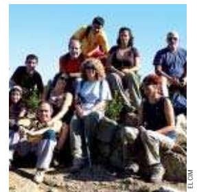
Foto de la primera sortida, a Les Maleles